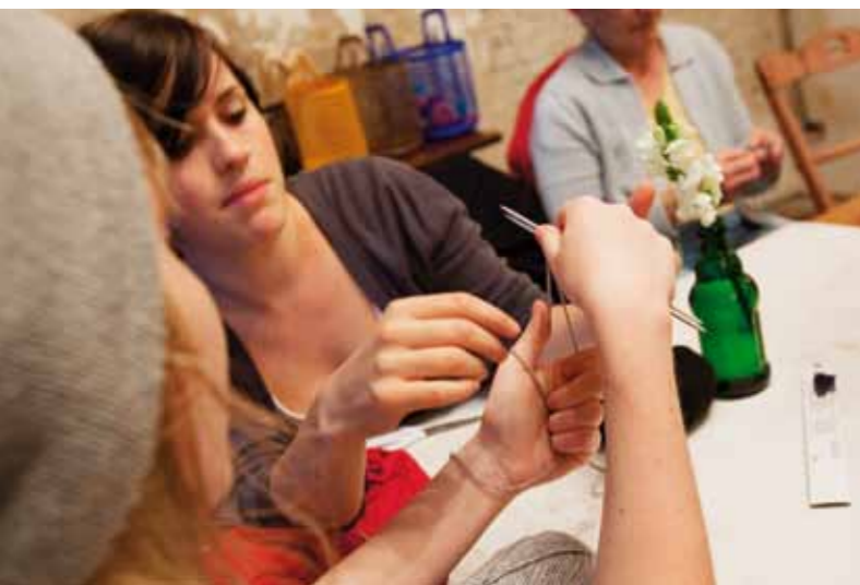
Stricken kann so gesellig sein. Im Kulturkonsumhaus Lokal in Hamburg stricken und häkeln die Handarbeiterinnen einmal im Monat gemeinsam.